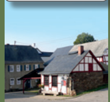
Gehlweiler, oude smederij

info@hunsruecktouristik.de www.hunsruecktouristik.de