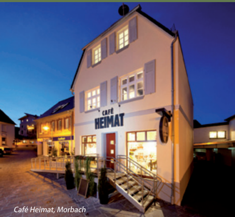
Café Heimat, Morbach